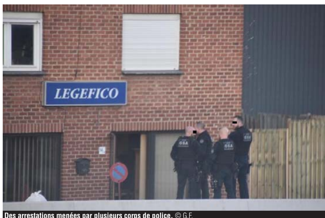
Des arrestations menées par plusieurs corps de police.

Cette affaire n'est pas sans rappeler une autre opération de ce type menée conjointement en