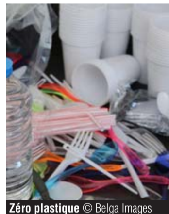
Zéro plastique

LA LOUVIÈRE – CHAPPELLE – CHÂTELET – MARCINELLE