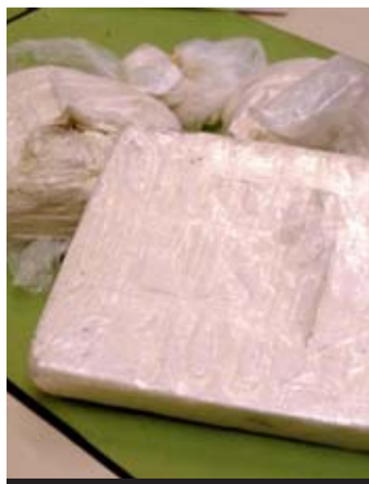
600 gr de cocaïne saisis.