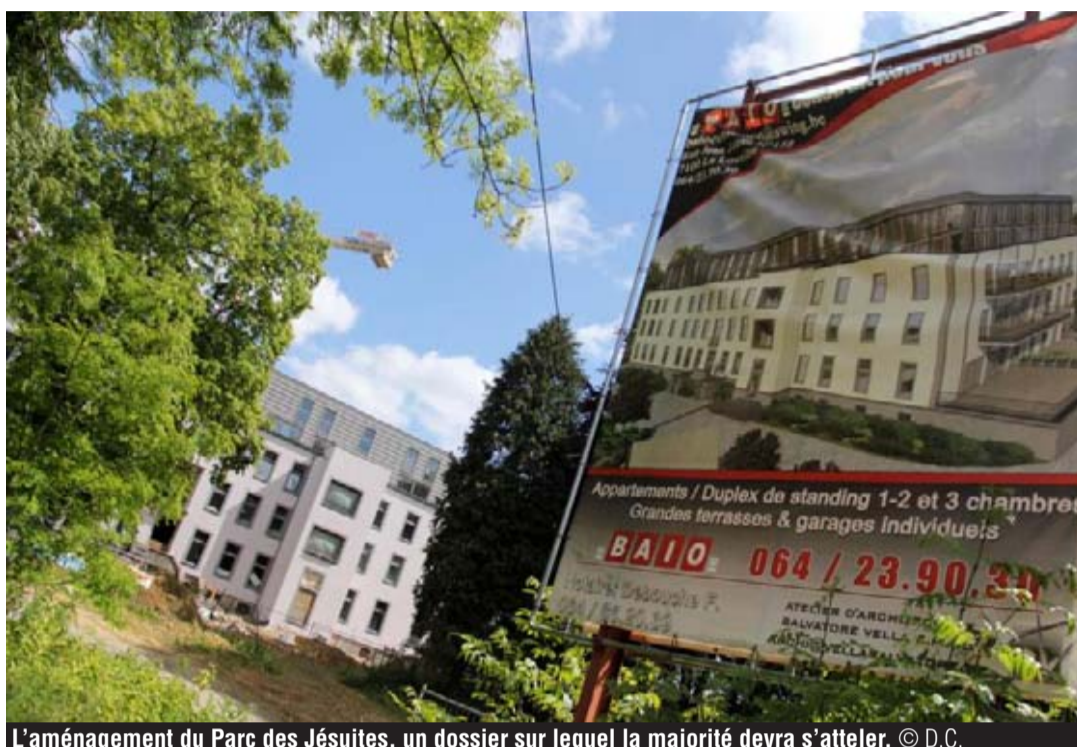
L'aménagement du Parc des Jésuites, un dossier sur lequel la majorité devra s'atteler.