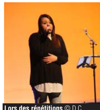
Lors des répétitions

à noter Stupid Girl, sortie le 6 mars sur Deezer, Amazon, Spotify