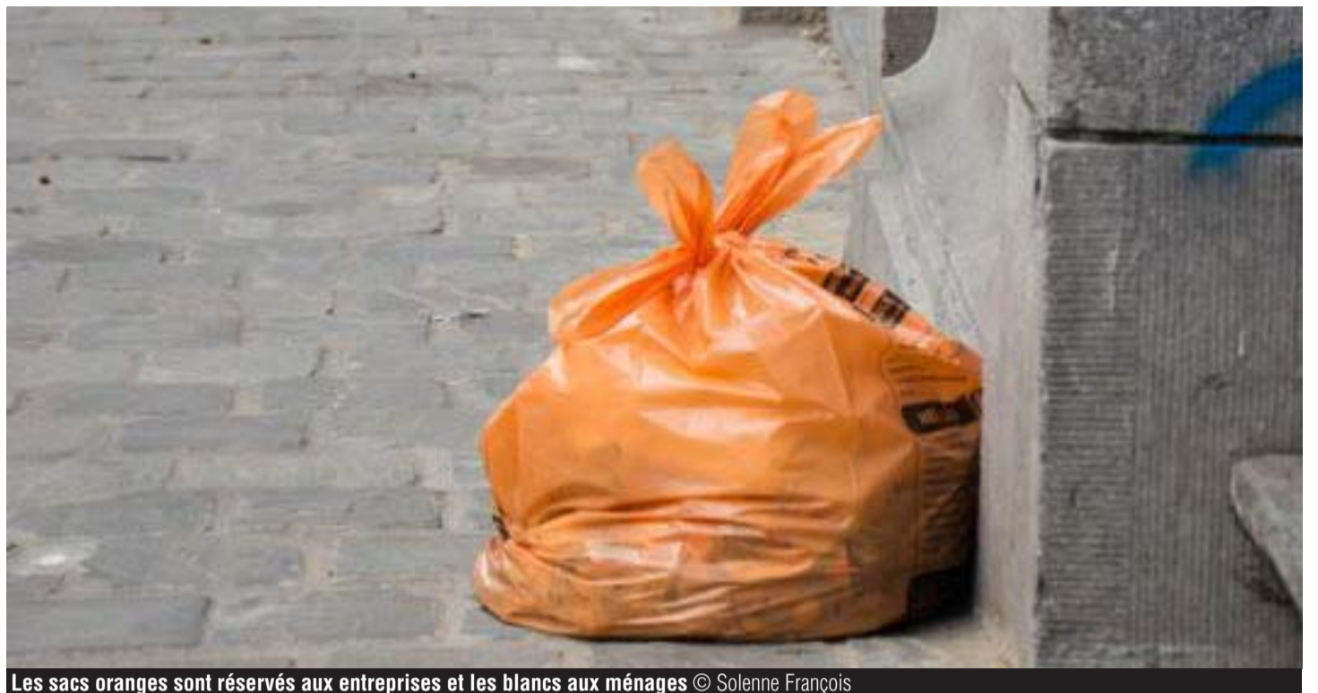
Les sacs oranges sont réservés aux entreprises et les blancs aux ménages

« Il y a des alternatives de sacs qui sont organisées. Tibi par exemple organise des collectes pour les privés. Ce sont alors des sacs oranges qui sont ramassés et que le commerçant paie comme les ménages