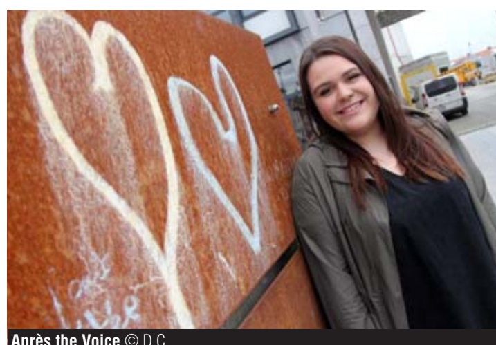
Après the Voice © D.C.