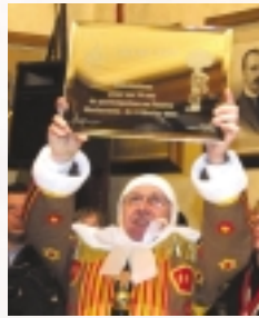
Une plaquette "souvenir" a été décernée aux gilles de "La Victoire" pour les 70 ans de la société