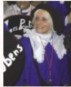
Une plaquette "souvenir" a été décernée aux "Peintres Rubens" pour les 10 ans de la société