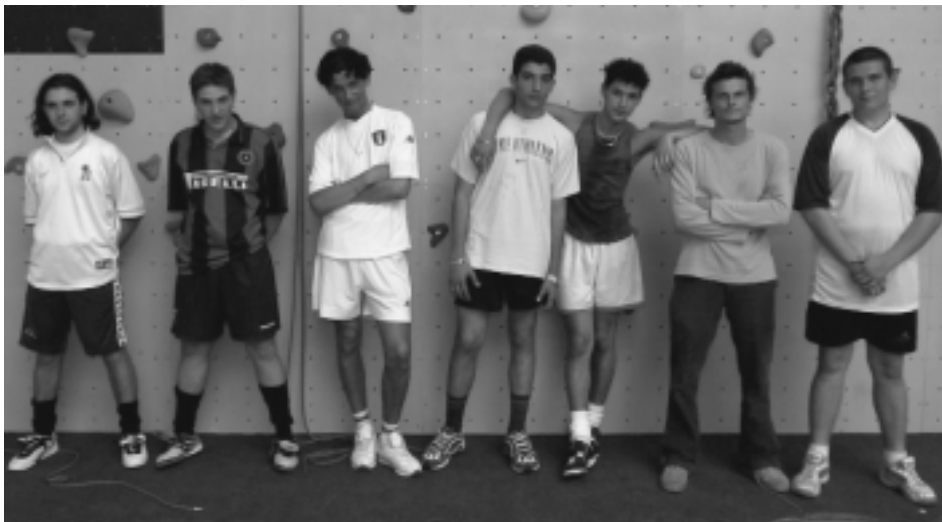
Les jeunes du quartier "Morlanwelz centre".