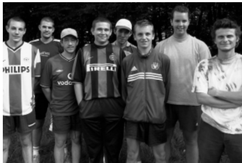
Les jeunes du quartier de la cité des Epines.

Grâce aux subsides de la Région wallonne nous avons développé un projet dont l'objectif principal est l'encadrement des jeunes.