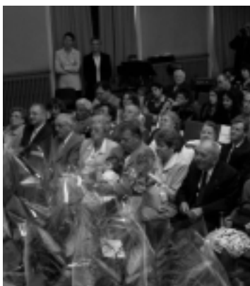
Amoureux depuis 50 et 60 ans, ils ont fêté leurs Noces d'Or. Page 7.