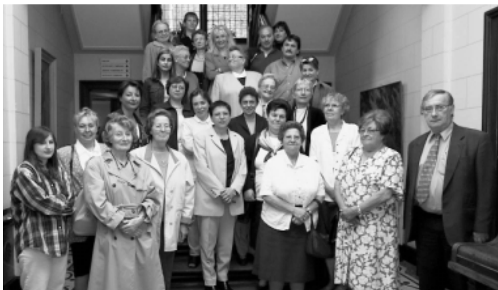
Les membres des 3 sections de l'O.N.E. de MORLANWELZ

LES MEMBRES DES 3 COMITÉS LOCAUX NOUS SIGNALENT QU'ILS RECHERCHENT DES PERSONNES BÉNÉVOLES DISPOSÉES À DONNER QUELQUES HEURES DE LEUR TEMPS POUR AIDER LES MAMANS ET L'INFIRMIÈRE LORS DES CONSULTATIONS.