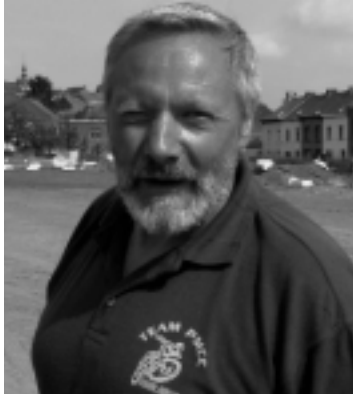
Motocross les 15 et 16 /09. Page 10.