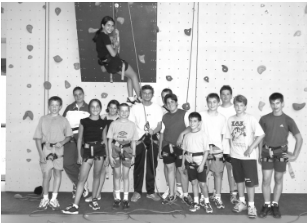
Stage sportif dans la nouvelle salle omnisports: "sur le mur d'escalade".