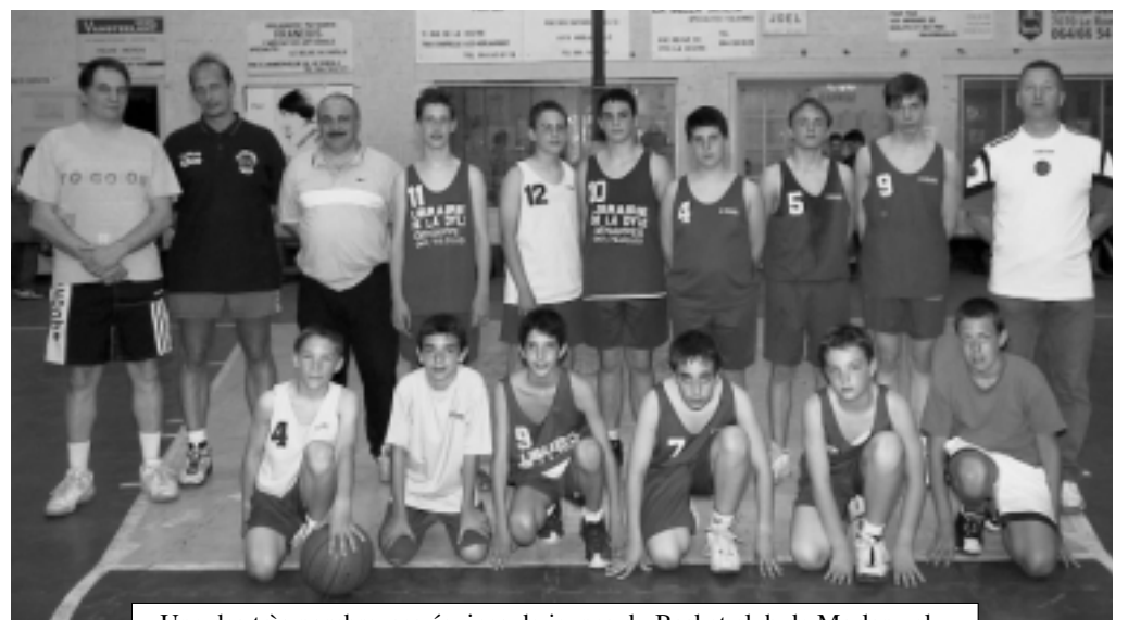
Une des très nombreuses équipes de jeunes du Basket club de Morlanwelz.