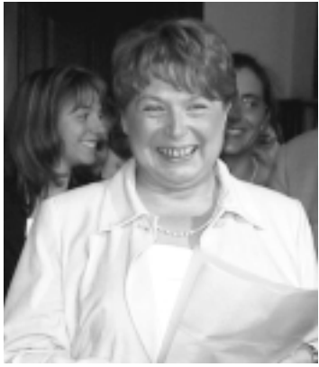
L'installation du Conseil de l'Aide. Page 3.

JOURNAL COMMUNAL D'INFORMATION N° 4 / 2001