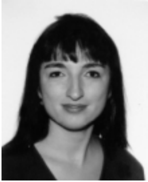
La Nuit de la Solidarité. Page 10.